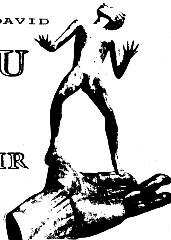
TABLE DES MATIERES DU DOSSIER